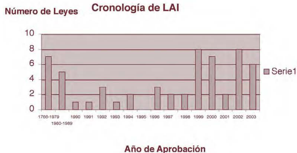
Figura 1: Cronología de las LAI

Puente: Elaboración de los autores con base en información de Banisar (2004).